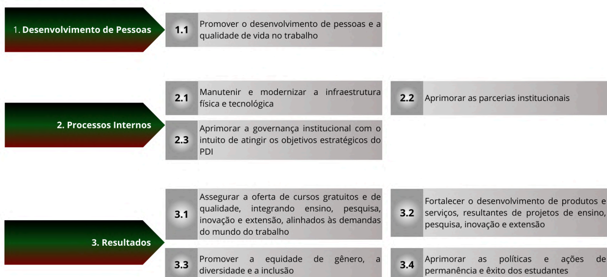
Figura 1 - Mapa Estratégico IFB - Elaboração: CGPL